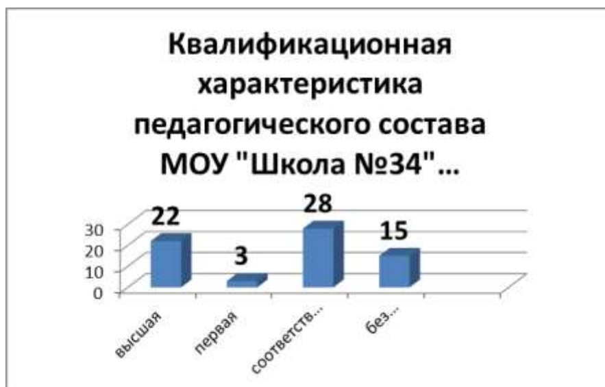
Таблица № 7.

Квалификационную характеристику педагогического коллектива можно проследить по диаграмме: